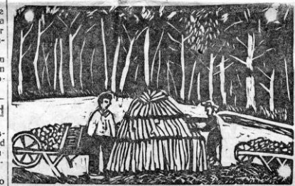
«CARBONEROS».—Cliché grabado por un niño de la escuela de Plasencia del Monte

Porque, ¡oh, paradoja de la civilización!, estas máquinas de imprimir que trae esta gente con tanta algarabía y que recibimos todos con tanta algarabía, tienen la misma sencillez y son tan por igual ingenuas y calmosas—en estos tiempos de las tragafantas rotativas—como el círculo de la primera imprenta que el citado