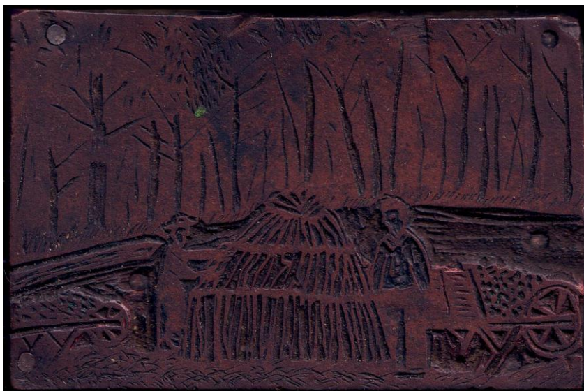
Carboneros, 1935. Plancha xilográfica. 70 x 110 mm

Plancha realizada por un alumno de la escuela de Plasencia del Monte (Huesca), cuyo maestro era Simeón Omella. Esta plancha forma parte del legado de Ramón Acín, actualmente en el Museo de Huesca.